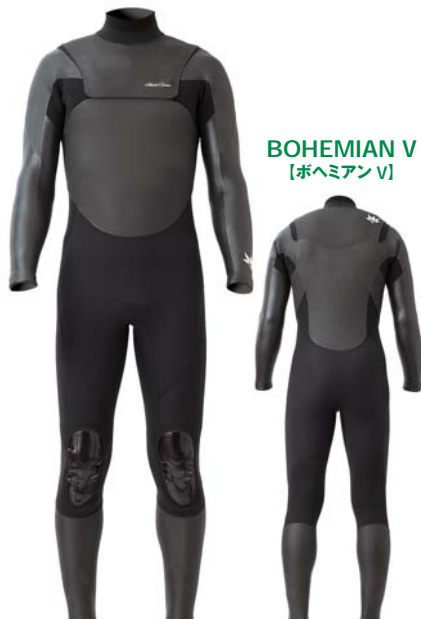
ベース: ブラックラバー / ライン: ブラック

上記の3色のロータス柄のプリント生地から選べます。 ※プリントマテリアルオプション価格:2,100yen